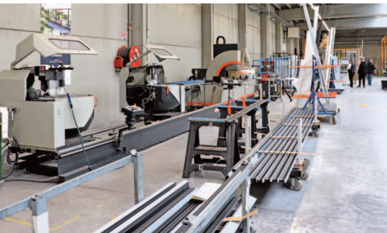
Zone de débit et usinage des barres d'aluminium, fournies en 1,5 mm d'épaisseur par Cortizo.