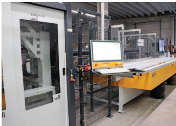
Le centre de débit-usinage PVC Schirmer installé en 2023.

Attentive à cultiver une grande proximité avec ses clients, Ouvêo Hauts-de-France les a invités à découvrir le nouveau show-room et les derniers aménagements intervenus dans l'usine lors d'une journée portes ouvertes le 19 avril dernier. « Nos clients, dont environ 500 sont des partenaires actifs, sont des acteurs régionaux de différentes tailles, essen-