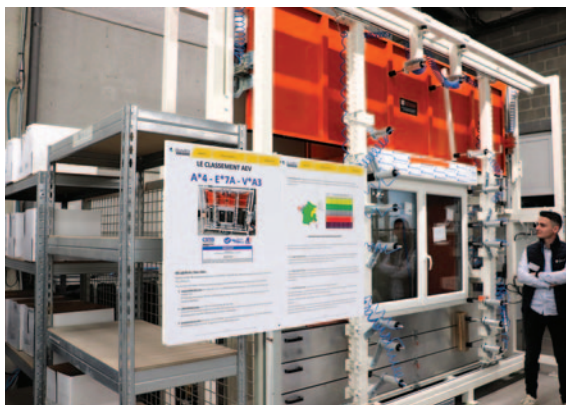
L'usine renforce l'étape de contrôle et la certification de ses produits, qui est gérée par Arthur Chœur, jeune responsable QSE embauché en 2023, lorsque sont arrivés les deux bancs d'essai : ici le banc AEV pour les menuiseries (deux sont testées par mois).