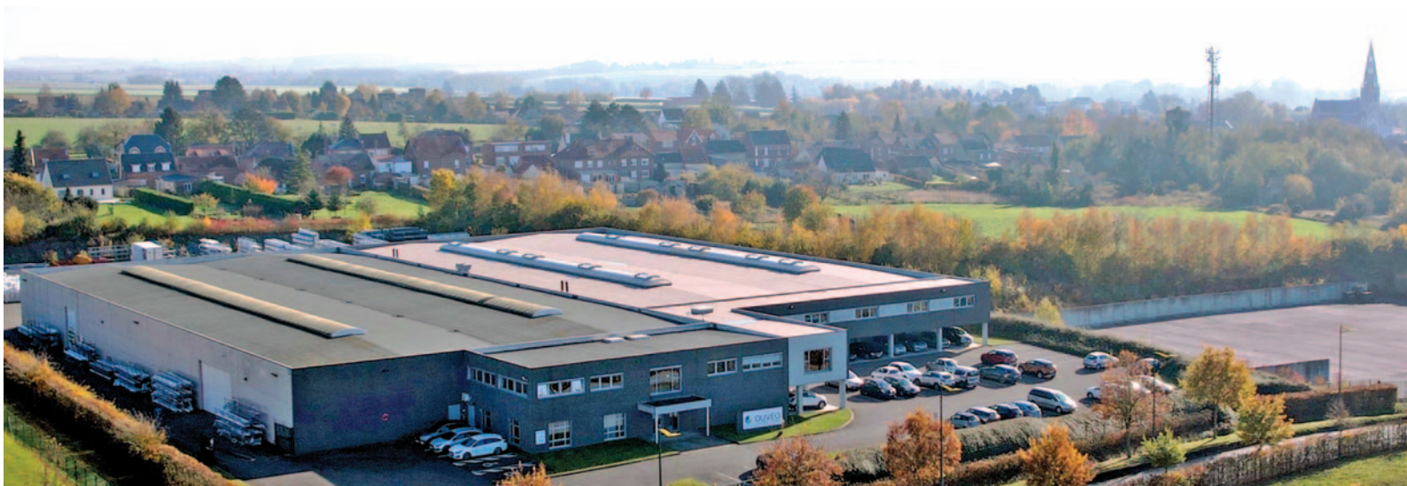
Le site d'Ouvéo Hauts-de-France : deux halls de production contigus qui totalisent 7 000 m 2 couverts.

millions d'euros, avec une contribution de la Communauté d'agglomération du Cambrésis et de la Région Hauts-de-France à hauteur de 100 000 euros chacune.