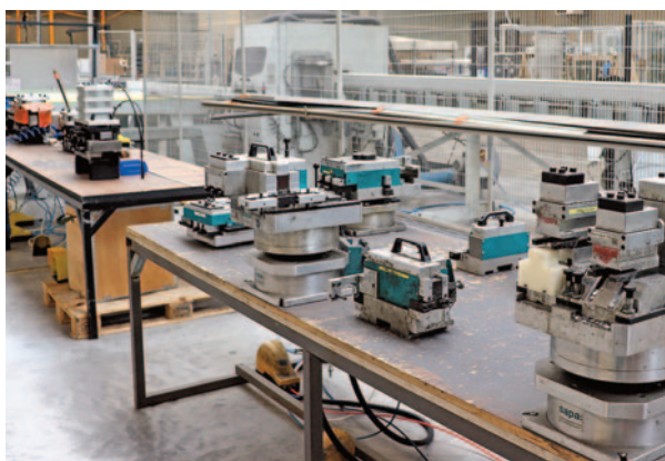
Zone de poinçonnage.