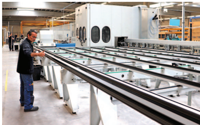
Centre de débit-usinage alu FOM (déplacé du site Ouvèdo d'Aquitaine).