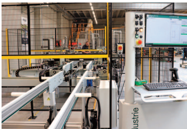
Cette sertisseuse FOM installée début avril 2024 améliore la qualité et la productivité.