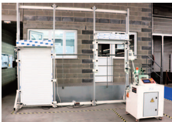
Et le banc test des volets roulants (un testé chaque semaine).